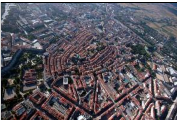
Vista aérea de Vitoria

Después del almuerzo, podremos disfrutar de una visita panorámica de la ciudad así como de un recorrido a pie por su casco antiguo, declarado conjunto monumental en 1997.