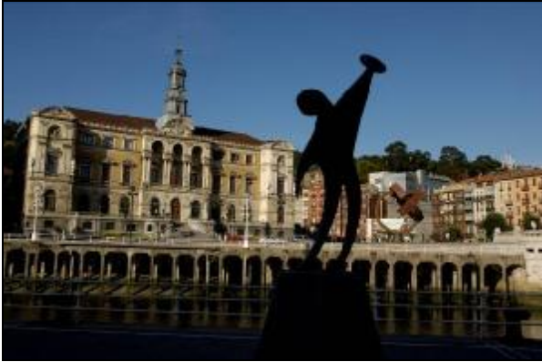
Ayuntamiento de Bilbao

comenzaremos una visita guiada a pie por el Casco Viejo.