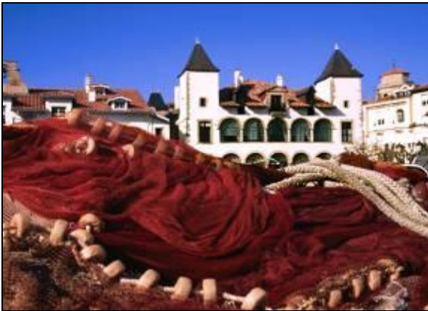
Redes y La Maison de Luis XIV, San Juan de Luz

Este edificio fue abierto en el año 1928, y fue una creación del arquitecto Mallet Stevens, considerado como una obra maestra del art decó nouveau.