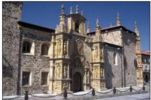
Universidad del Sancti Spiritus de Oñati

Desayuno. Nuestro guía recogerá a los clientes en el Hotel para comenzar la excursión hacia Oñati , la villa más señorial y monumental de Guipúzcoa por su grandeza artística en edificios de verdadero valor arquitectónico.