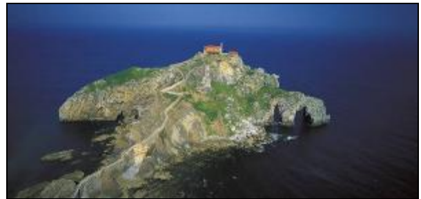
San Juan de Gaztelugatxe

Seguimos recorrido para pasar por el imponente Castillo de Butrón con sus 45 metros de altura y por Mungia. Desde aquí nos dirigiremos hacia la costa hasta San Juan de Gaztelugatxe , preciosa ermita enclavada en la punta de un peñasco que reposa en el mar. Breve parada para admirar sus espectaculares vistas y poder hacer unas fotos.