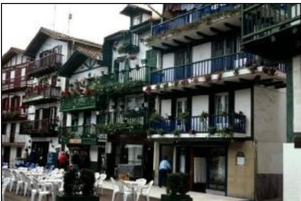
Barrio de Pescadores de Hondarribia

Tras la visita por la carretera hacia el sur llegaremos hasta Hendaya , ciudad fronteriza. Desde aquí tomaremos el barco que cruza la bahía de Txingudi y nos llevará hasta la otra orilla, hasta Hondarribia .