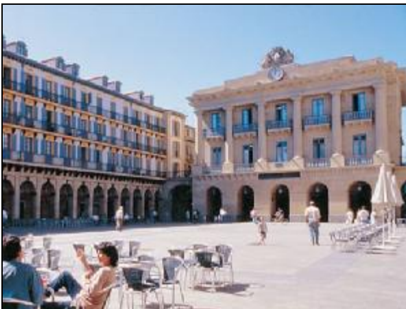
Plaza de la Constitución

Cerca del puerto viejo, recorreremos sus calles, edificios, tabernas y restaurantes típicos, bares de pinchos, el convento dominico (siglo XVI), la basílica de Santa Maria de Coro (siglo XVIII), en la cual se venera a la patrona de la ciudad y llegar a la plaza de la Constitución, uno de los lugares más característicos de la Parte Vieja, cuyo edificio principal fue durante años el Ayuntamiento.