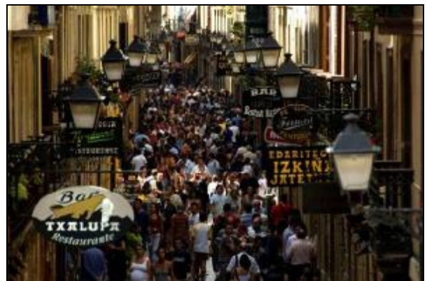
Casco Viejo de San Sebastian

Una vez en San Sebastian , efectuaremos un recorrido panorámico para poder apreciar las magnificas avenidas y paseos así como el estilo impecable con que San Sebastián adquiere su estilo de ciudad hermosa, limpia y atractiva. Podremos apreciar la panorámica del palacio Kursaal, obra destacada del artista Rafael Moneo, el Teatro Victoria Eugenia y las magnificas casas señoriales de tono piedra caliza. Desde el monte Igeldo podremos dominar en altura todo lo que esta magnífica ciudad inmortalizada en tantas ocasiones ofrece a los visitantes.