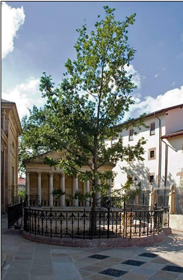
Árbol de Gernika

Seguimos el viaje recorriendo la ría de Mundaka hacia el sur y alejándonos un poco de la costa para llegar a Gernika , capital emblemática de los vascos por su famoso Árbol y su Casa de Juntas. Aquí almorzaremos en uno de sus típicos restaurantes.