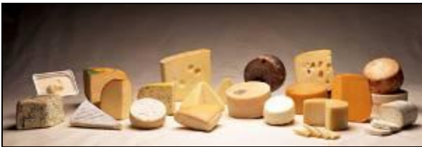
Surtido variado de Queso Idiazabal D.O.

Asimismo, visitaremos una quesería para poder conocer más de cerca la elaboración de este alimento.