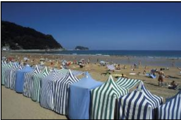
Toldos en la Playa de Zarautz

La playa se encuentra abierta al mar y sus espectaculares olas sirven de reclamo para miles de aficionados al surf. De hecho, Zarautz acoge cada mes de septiembre un destacado campeonato inscrito dentro del circuito mundial.