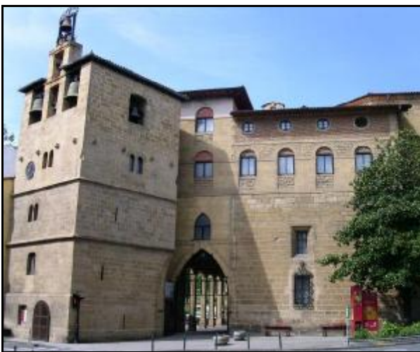
Santa Maria La Real, Zarautz

En el extremo oriental de la playa, al final del paseo marítimo, junto a la desembocadura del río Iñurritza, hay una zona de dunas, la más extensa del litoral guipuzcoano. Declarado biotopo protegido, una pasarela nos permite visitar este espacio natural que sirve de cobijo a muchas especies de aves.