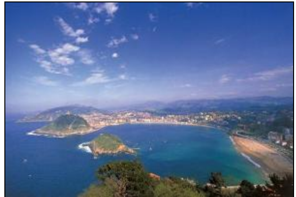
Bahía de la Concha de San Sebastián

A continuación, almorzaremos en uno de sus restaurantes. Después del almuerzo, continuaremos el recorrido hacia San Sebastian.