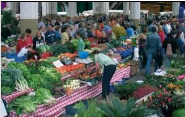
Mercado semanal en Ordizia, Gipuzkoa.

A continuación, llegaremos a la villa de Ordizia, pueblo típico de la zona del Goierri, con un antiguo casco histórico y núcleo de la villa declarado como Conjunto Monumental-Histórico. Pero el gran atractivo de Ordizia está en el Mercado de productos del país, cuyo origen data del siglo XI y XII. Su celebración tiene lugar todos los miércoles del año , razón inexcusable en nuestro recorrido para realizar una breve parada para pasear por sus calles y disfrutar de este ambiente exclusivo.