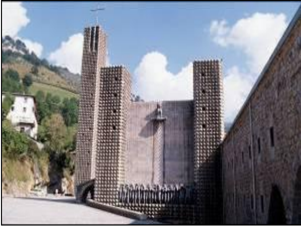
Santuario de Arantzazu

de la orden Franciscana y rodeado de un singular espacio geográfico.