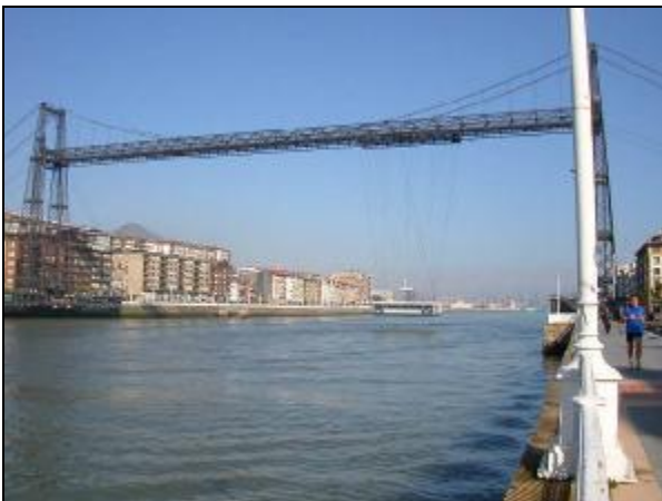
Puente Colgante de Portugalete

Tras finalizar la visita de Bilbao nos dirigiremos hacia la desembocadura de la ría de Bilbao, donde podremos contemplar el Puente Colgante de Bizkaia (declarado patrimonio de la humanidad por la UNESCO), punto de unión de los pueblos de Getxo, en donde nos encontramos y enfrente, en la Margen Izquierda, Portugalete.